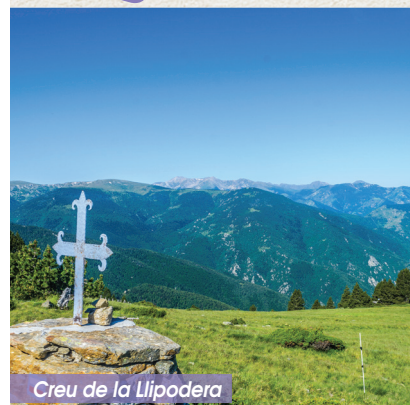
Creu de la Llipodera