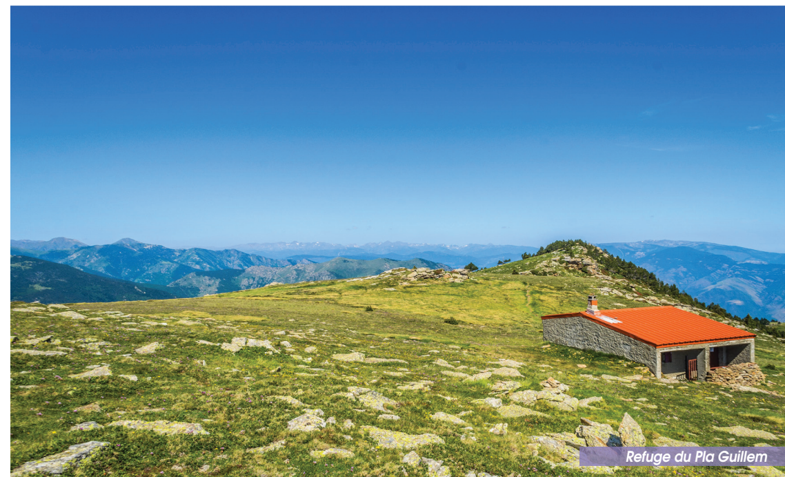
Refuge du Pla Guillem