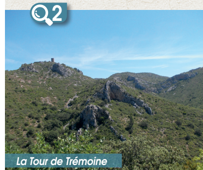
La Tour de Trémoine

La seigneurie de Rasiguères était détenue au XI e siècle par les vicomtes de Fenouillet. La commune fut rattachée au royaume de France par le traité de Corbeil en 1258. Le village primitif de Rasiguères se situait probablement au Castellas Q1 , ferme fortifiée aujourd'hui en ruine. On trouve également sur la commune la Tour de Trémoine Q2 , vestige d'un ancien château servant principalement de Tour à signaux.