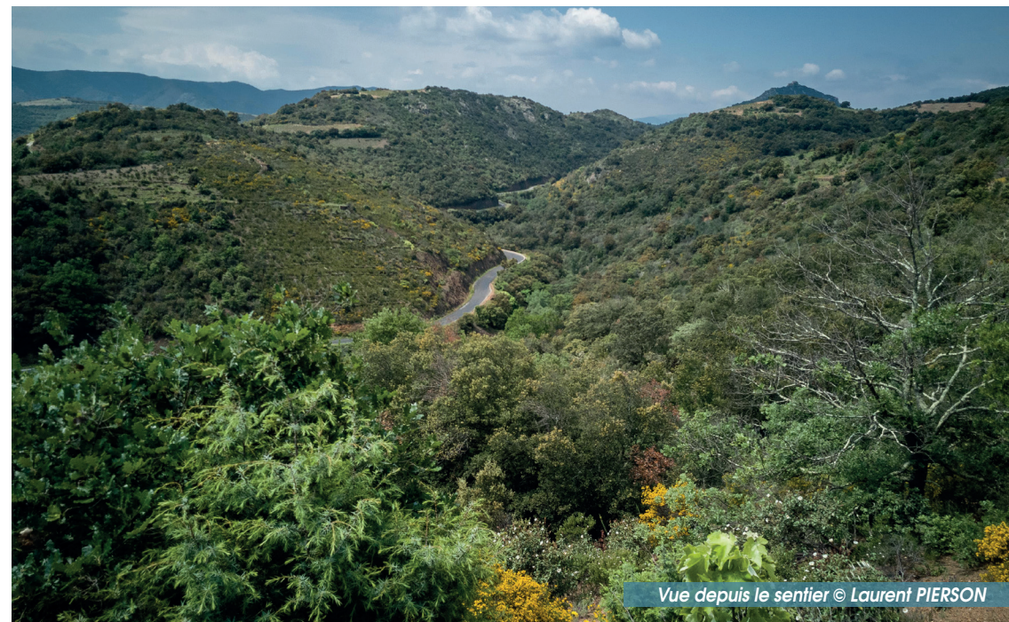
Vue depuis le sentier