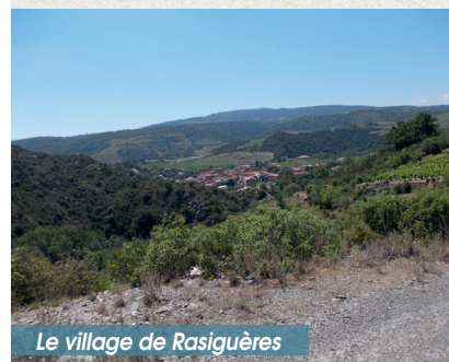
Le village de Rasiguères