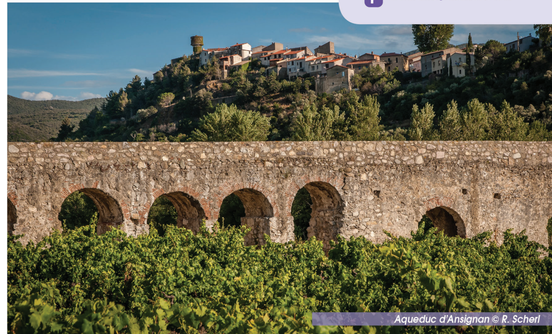
Aqueduc d'Ansignan