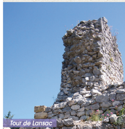
Tour de Lansac