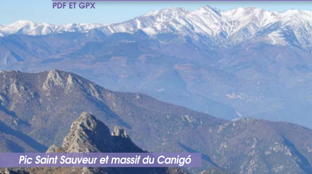
Pic Saint Sauveur et massif du Canigó