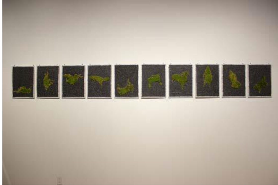
DENSE DE ROADKILLS 2017, PANNEAUX DE BOIS, ASPHALTE ET MOUSSE VÉGÉTALE, 340X40X2 CM