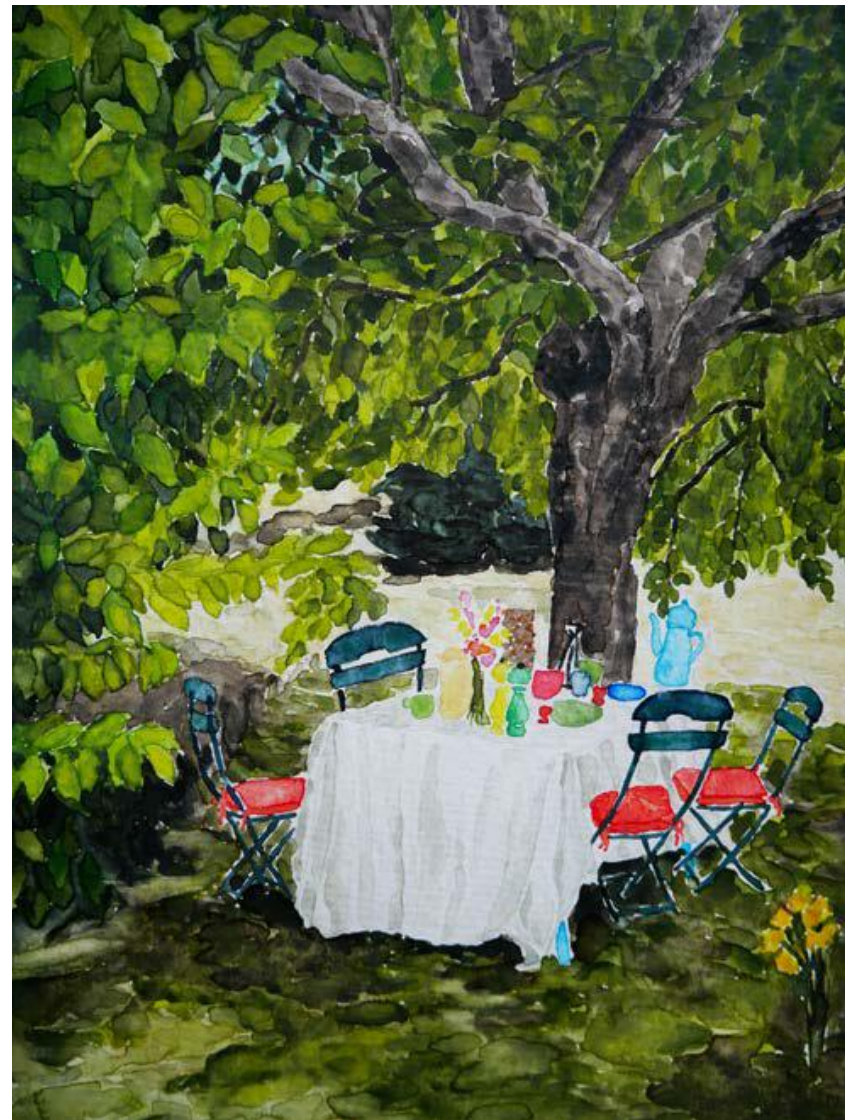
TABLE SICILIENNE 2023 AQUARELLE 15,5X21 CM