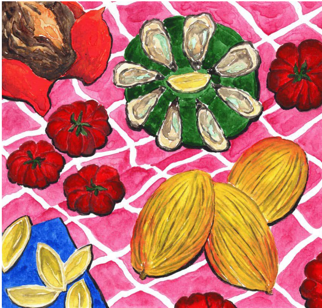
JOLIE TABLE D'ICI 2023 AQUARELLE 20X20CM