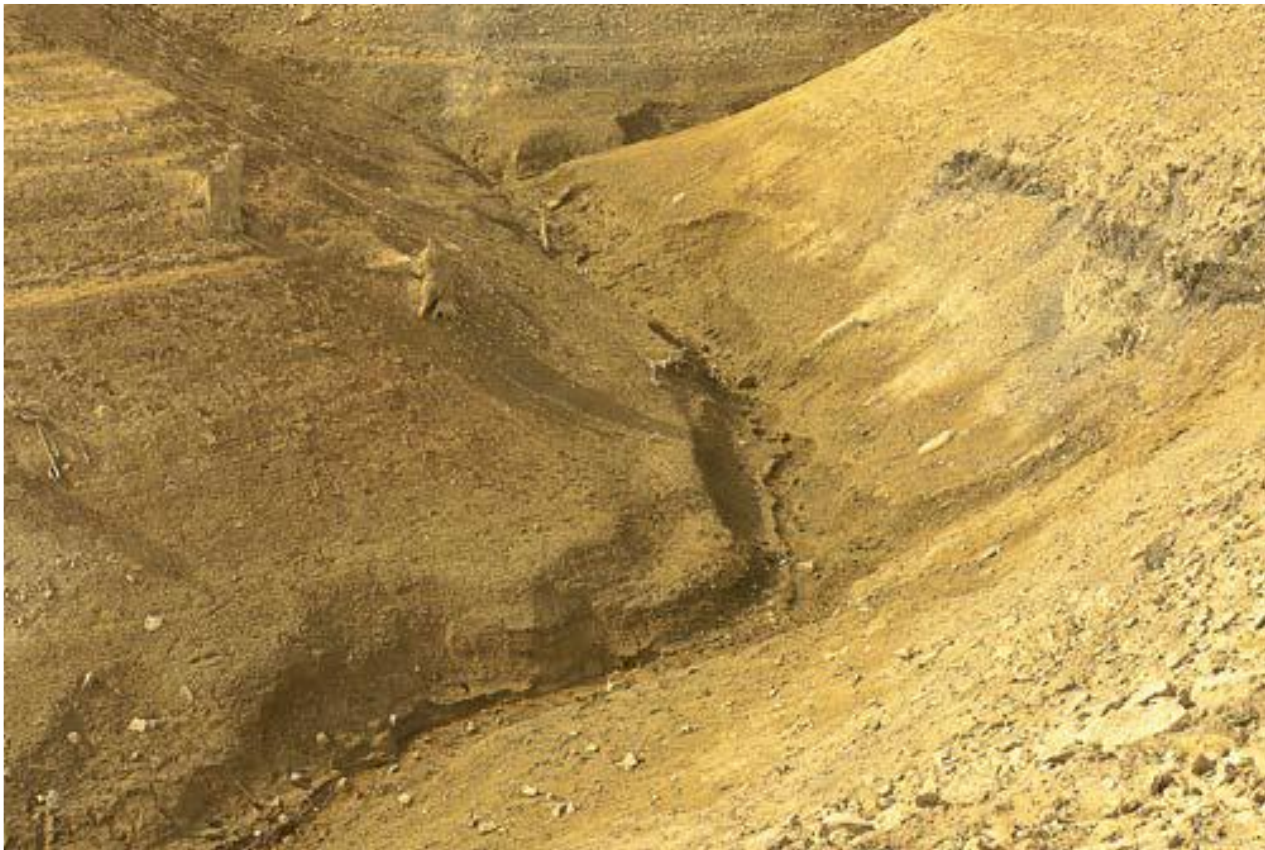
PRINTEMPS 1, 2022, TIRAGE NUMÉRIQUE