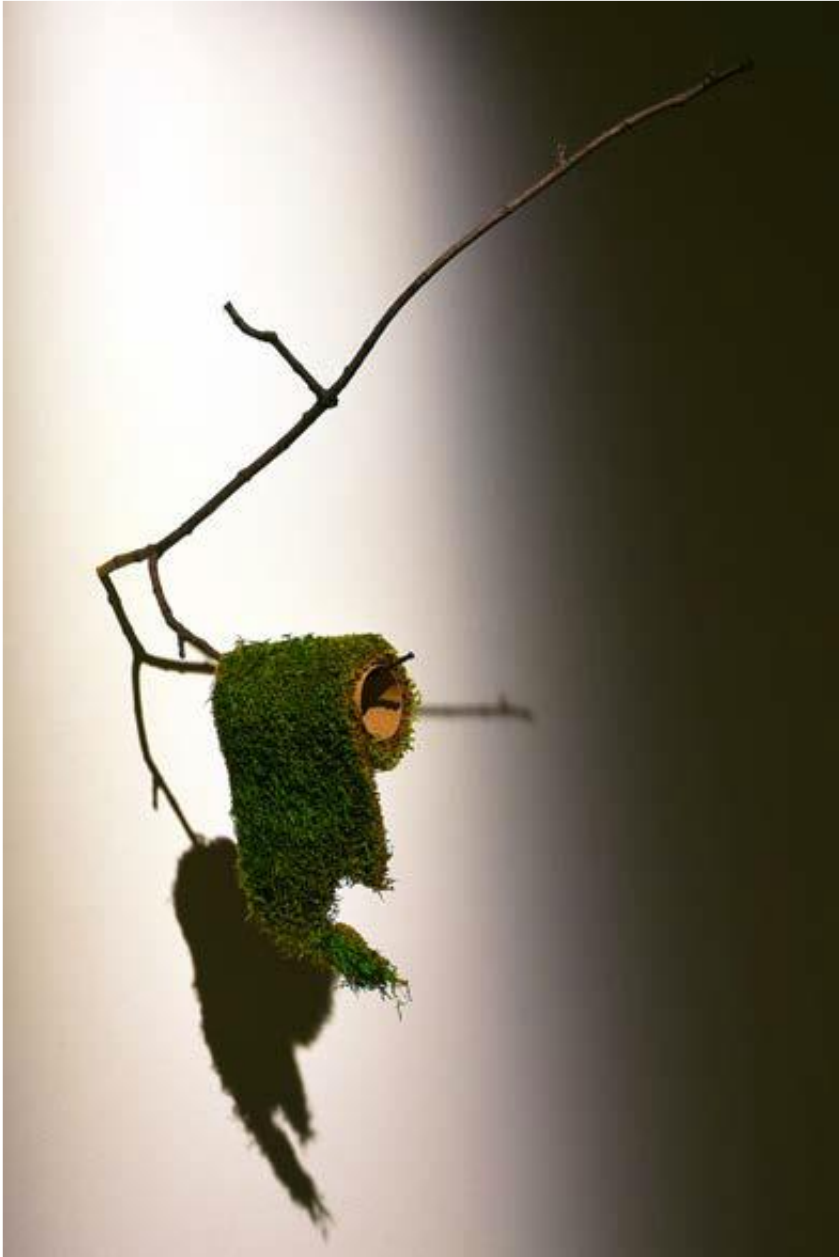
NE M'OUBLIE PAS 2020, BRANCHE, MOUSSE VÉGÉTALE ET CARTON 27X10X8 CM