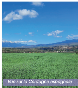
Vue sur la Cerdagne espagnole

Cet itinéraire passe sur le Pla de Dalt, magnifique endroit pour contempler la Cerdagne et la comprendre. Un panneau présent sur place présente la formation géologique de la Cerdagne, formée entre 20 et 10 millions d'années par effondrement tectonique entre deux failles majeures : la faille de la Têt et la faille d'Estavar. C'est l'occasion notamment d'observer que cette haute plaine est le réceptacle des différentes vallées : Carol, Angoustrine, Eyne, Llo, Err, Osseja... Ces vallées sont en forme de « U », preuve qu'elles ont été remplies par des glaciers lors des périodes glaciaires.