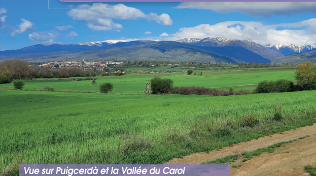
Vue sur Puigcerdà et la Vallée du Carol