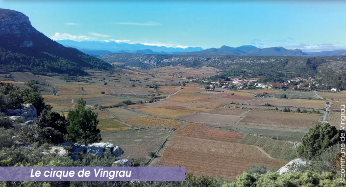
Le cirque de Vingrau