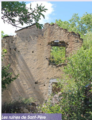
Les ruines de Saint-Père

A l'entrée de la Vallée du Carol, à 1200 m d'altitude, Latour de Carol regroupe les hameaux de Quès, Riutès, Saint Pierre de Cedret et le plus ancien, Yravals. Ce vieux village agricole et pastoral devient, au XVIII e et XIX e siècles, un centre actif de négoce (bestiaux, tissus) ainsi qu'un pôle économique (peaux, laines et filatures). Au début du XX e siècle, l'arrivée du chemin de fer, du Train Jaune en 1927, du Transpyrénéen en 1929, permet l'implantation d'une gare Internationale. Latour de Carol présente de nombreux attraits. Dressée sur un éperon rocheux, Saint Etienne domine le village. On y accède par un escalier monumental. Cette église romane, remaniée au XVII e siècle, abrite une magnifique collection de rétables. A Yravals, l'église Saint Fructueux, classée par les monuments historiques, est représentative du premier art roman.