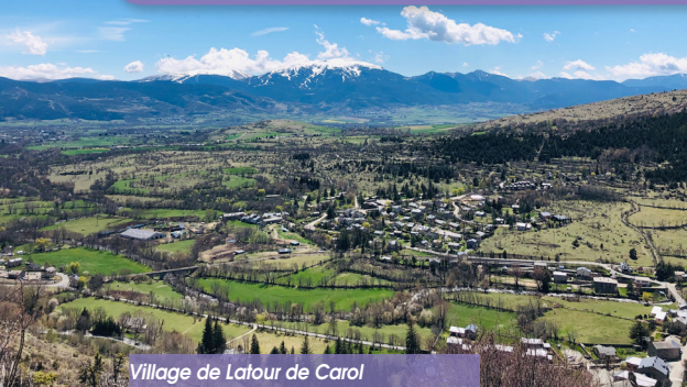
Village de Latour de Carol