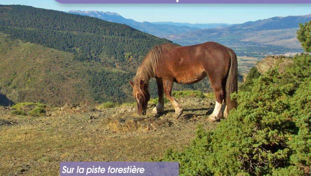
Sur la piste forestière

SAILLAGOUSE - VEDRIGNANS ERR - SAILLAGOUSE