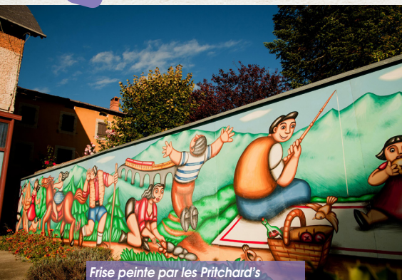
Frise peinte par les Pritchard's