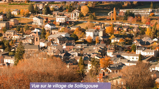
Vue sur le village de Saillagouse

SAILLAGOUSE-CAILLASTRES-MAS ST JOSEPH-GORGUJA-ERR- VEDRIGNANS-SAILLAGOUSE