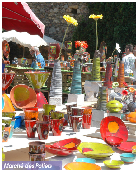
Marché des Potiers

Derrière le village, vous apercevrez des terres ravinées composées de limons rougeâtres, d'argiles, de débris de schiste, de granites et de sables. Ces terrains, appelés «mauvaises terres» par les géologues ont été modelés par les glaciers du quaternaire. Ces formations sont fragiles et subissent un phénomène d'érosion qui les détruit petit à petit. Grâce à ces sédiments, une quinzaine de potiers exerçaient leur métier à Saillagouse au début du XX e siècle. Chaque année, début août, la commune de Saillagouse organise le marché des potiers dans les jardins de la mairie. Vous pouvez découvrir un large panel de céramiques montrant la diversité et la richesse du travail de l'Argile. Grès décoré ou émaillé, terre vernissée, bijoux, faïence ou encore raku, toutes les techniques et tous les styles y sont représentés.