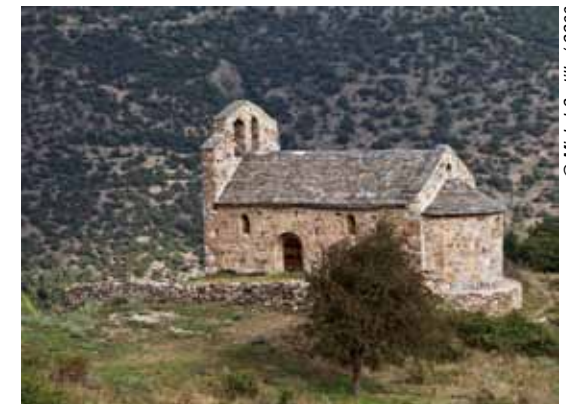
La chapelle d'En.

5 Contourner la première ruine par la gauche, puis par la droite. Au milieu des maisons, suivre la ruelle principale qui tourne deux fois de suite à gauche. Au deuxième virage, effectuer un bref aller-retour vers la droite pour découvrir la magnifique chapelle romane (XII e siècle) érigée en plein champ.