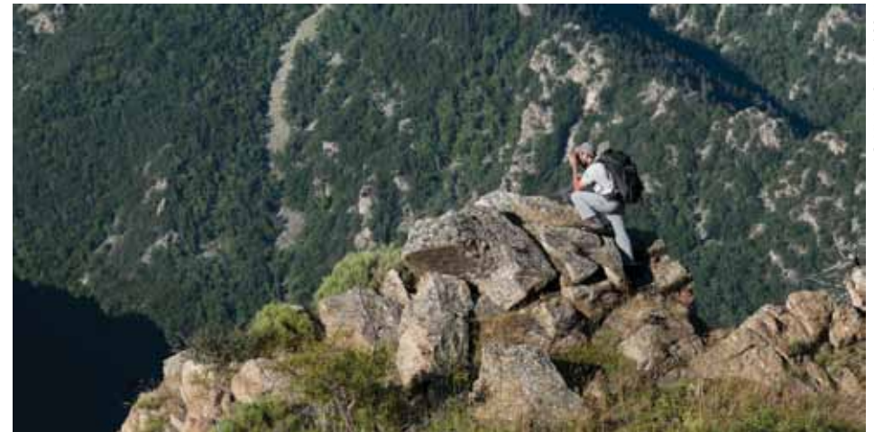
La Réserve naturelle régionale de Nyer, gérée par le Conseil Général, domine le hameau d'En.