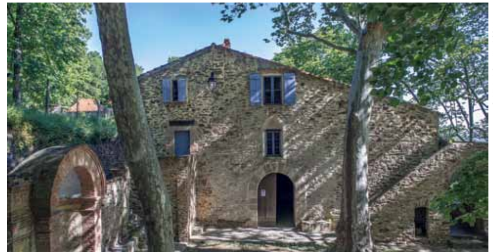
Sur le chemin, l'ermitage de Notre-Dame-de-Consolation.