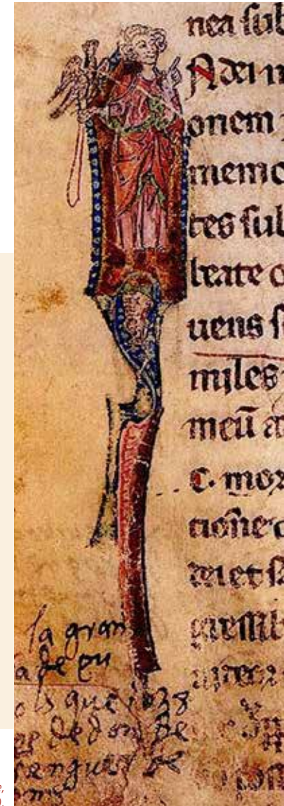
Registre de Perpignan (1300-1600).