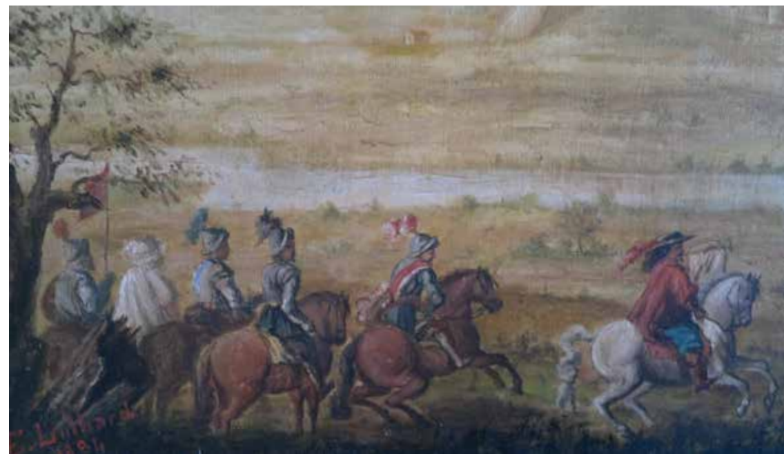
Tableau de xxxx, Caserne Mangin © Collection Ministère des Armées

(chargée des Projets de médiation du Patrimoine, Animation du Patrimoine, Ville de Perpignan).