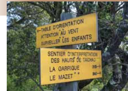
La signal tique de l'itin raire

Pensez   r server ! Retrouvez toutes les offres sur www.tourisme-pyreneesorientales.com Rubrique « organiser votre s jour » - « O  dormir ? » Informations r servations meubl s de tourisme : G tes de France des Pyr n es-Orientales 33 (0)4 68 68 42 88 www.gites-de-France-66.com Cl vacances des Pyr n es-Orientales 33 (0)4 68 51 52 53 www.tourisme-pyreneesorientales.com