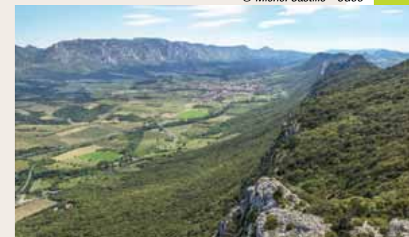
Le synclinal de St-Paul-de-Fenouillet vue depuis les cr tes

nantes falaises. Nous nous trouvons aussi sur l' picentre des s ismes nord-pyr n ens, les derni res fortes secousses datent de 1996 et 2004.