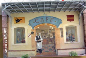
Mairie de MAURY