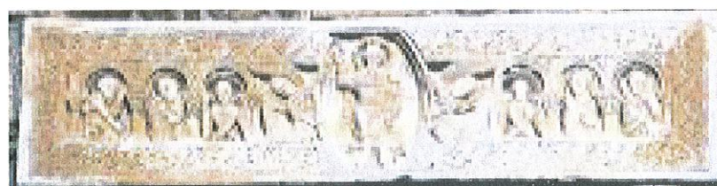
Linteau roman (1030) Saint André