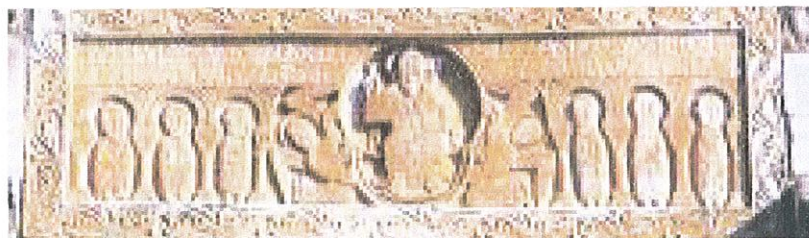
Linteau roman (1020) Saint Génis des Fontaines

100 m a la dreta, per agafar a l'esquerra el camí que passa davant del mas Blanc . Passat el mas de la Puça, girem a la dreta. Al mas Malzac (en ruïnes), ens enfilem a l'esquerra pel camí de la Muntanya. En un revolt el deixem a l'esquerra i agafem la pista que, dominant els masos dels Serrallers i d'en Lis, ens porta a la casa de jubilats Les Valbères.