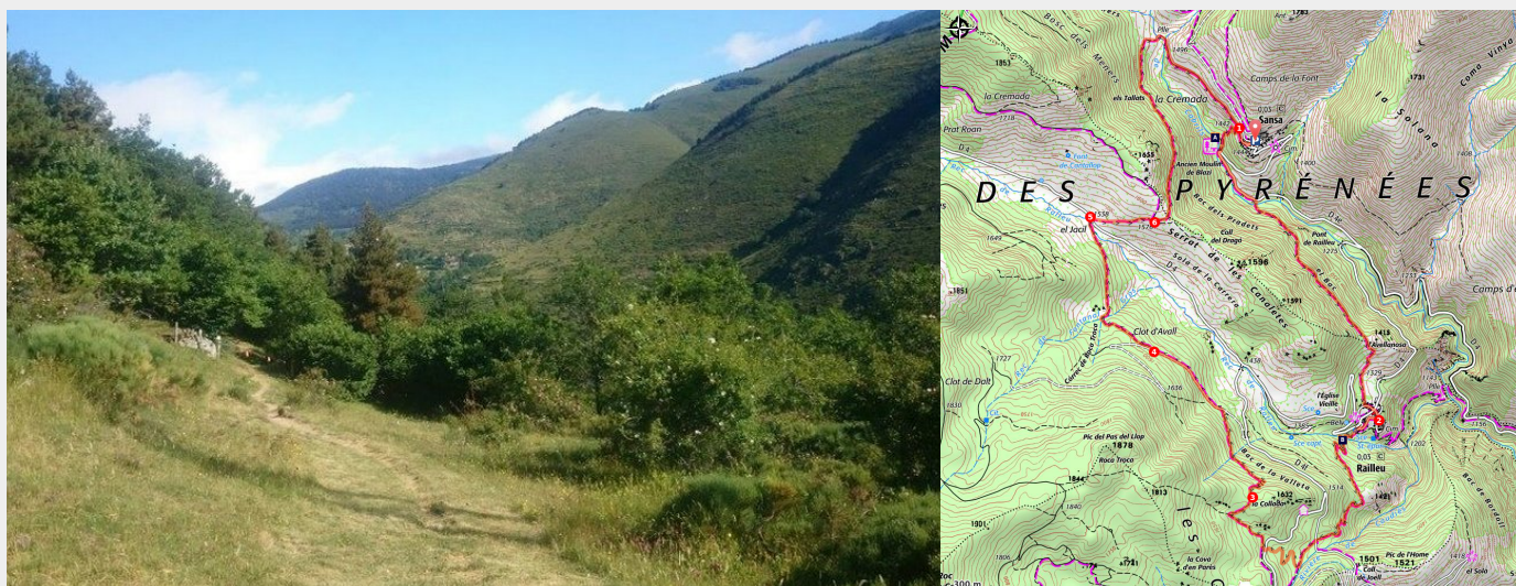
Les Garrotxes

Une sortie originale pour aller écouter le brame du cerf !