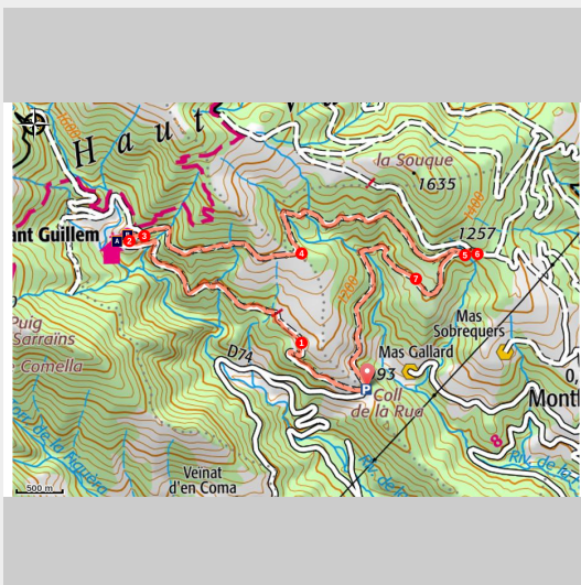
Chapelle de Sant Guillem