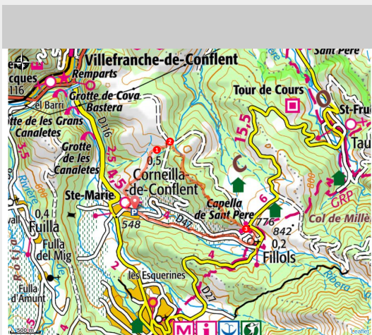
Eglise Sainte-Marie de Corneilla-de-Conflent (OTI Conflent Canigó)