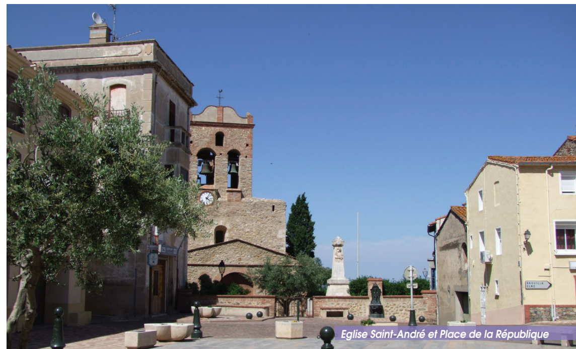
Eglise Saint-André et Place de la République