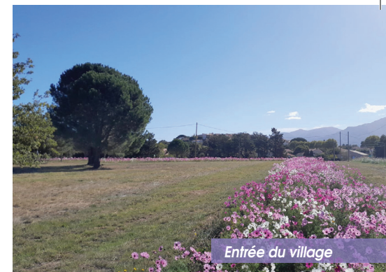
Entrée du village

Marché de Banyuls-Dels-Aspres : tous les mercredis matins