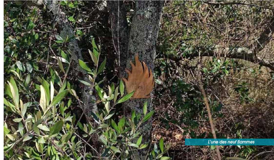
L'une des neuf flammes