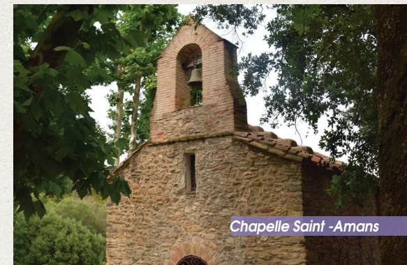
Chapelle Saint -Amans

De style roman, elle accueille la bénédiction des petits pains, le 8 avril ainsi que la bénédiction des bouquets pour la Saint-Jean..