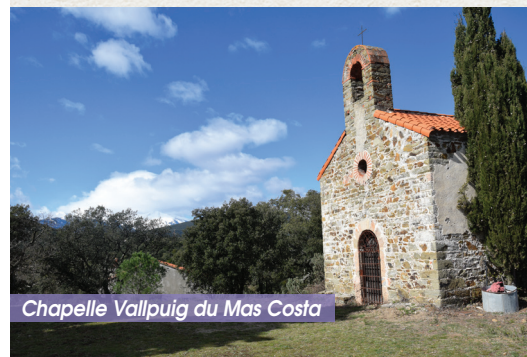
Chapelle Vallpuig du Mas Costa