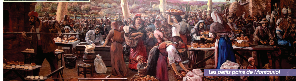
Les petits pains de Montauriol