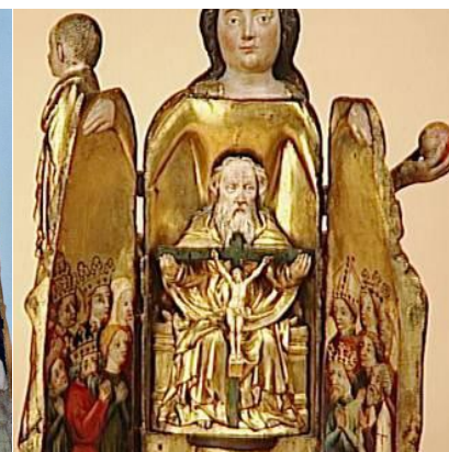
Vierge de Cluny (45cm-1400 environ)