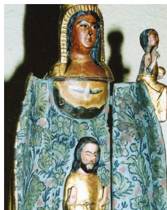
Vierge de Palau del Vidre (76cm-1450environ)

Le motif floral peint à l'intérieur du manteau de notre vierge date du XVIIème siècle. Il est fort possible que sous ce motif se cachent d'autres peintures semblables à celles présentées dessous.