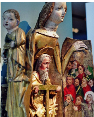
Vierge de Nuremberg (126cm-1395 environ)