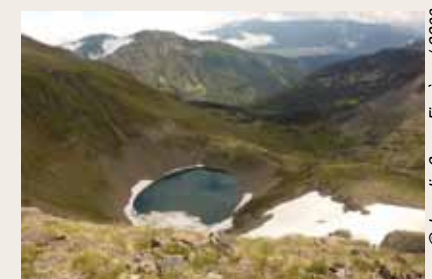
L'étang du Diable depuis le Mortiers.

de Mortiers, ce sommet jouxte un col du même nom. Quelle aventure, quel conte ou quelle légende aujourd'hui oubliés sont-ils à l'origine de ce mystérieux toponyme ?