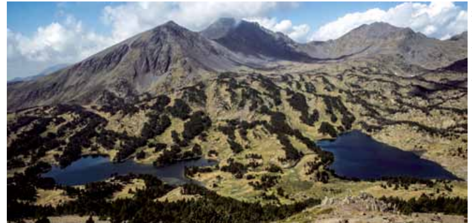
L'Estany del Mitg et les deux Pérics : vue depuis la Serra de Mauri.