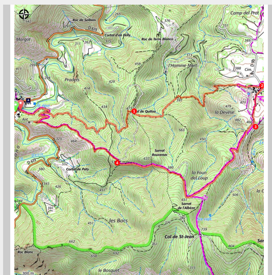
Vue depuis le sentier