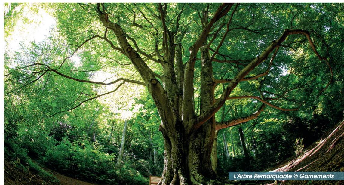
L'Arbre Remarquable

A l'église de Le Vivier, Panneau de départ Place de la Mairie