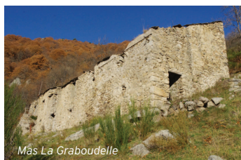
Mas La Graboudelle