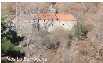
Mas La Barragane

Dans le centre ville de Prats-de-Mollo, un érable platanoïde, arbre-symbole du tracé végétal, a été planté sur la place de la Vila d'Amunt.