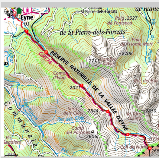
Vallée d'Eyne