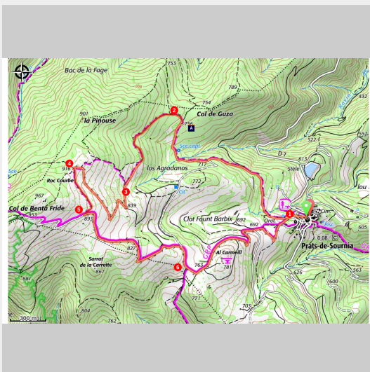
Elevage bovin à Prats-de-Sournia