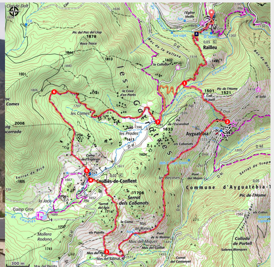
Village de Railleu