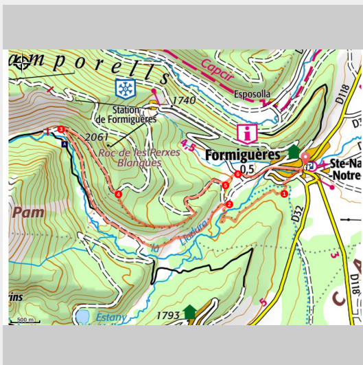
Vallée de la Lladura